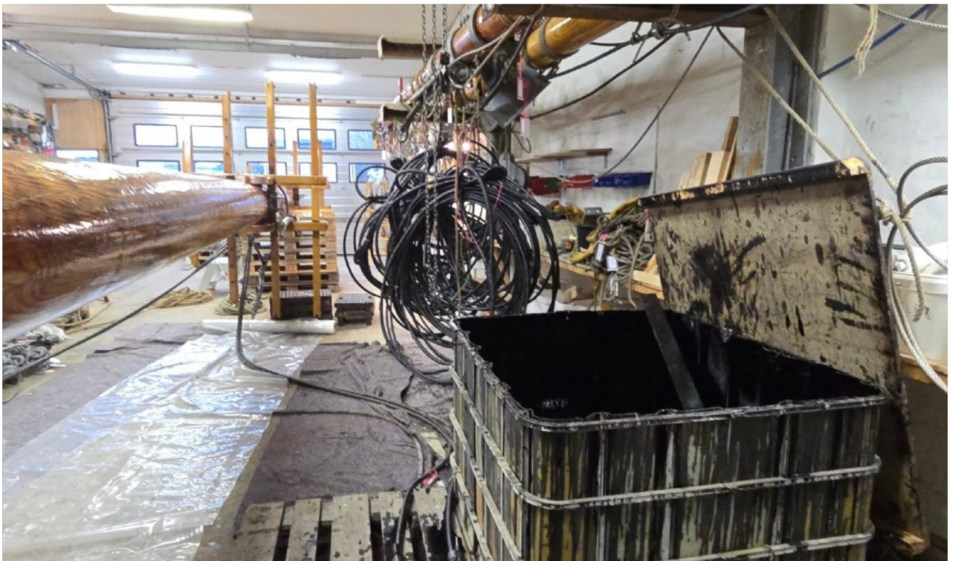
Sort arbejde? (Vi skulle spørge fra Leif..)

Endnu en forening, der er udsprunget af miljøet omkring LOA og LOA Værft, er Utzon Dock. Som vi beskrev i seneste nummer af LOAvisen, blev der i slutningen af 2025 foretaget en formel stiftelse af foreningen og siden har den fået egen hjemmeside. Den finder du på adressen www.utzondock.dk , hvor der blandt andet er information om Utzon Docks aktiviteter, om Utzon-spidsgatterne og om tankerne bag foreningen.